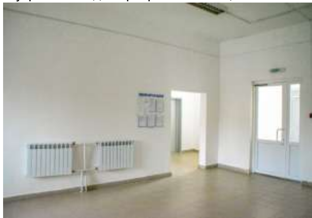
Фото 1. Места общего пользования

Внутренний вид квартир и мест общего пользования, представлены на фото 1 - 8.