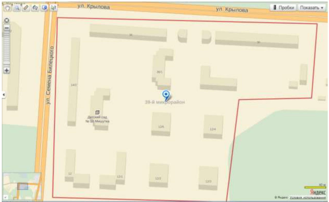
Рис. 1. Местоположение жилого дома, в котором расположены оцениваемые объекты недвижимости Прочие характеристики местоположения представлены в табл. 5.