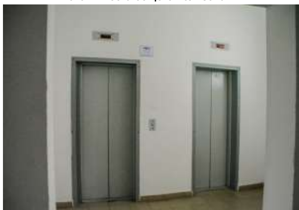
Фото 3. Лифт