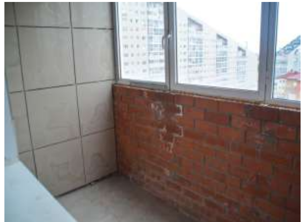
Фото 8. Оцениваемые квартиры (вид внутри)