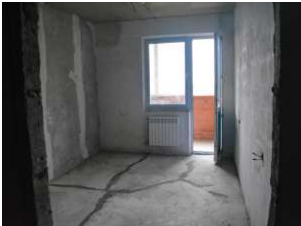
Фото 7. Оцениваемые квартиры (вид внутри)