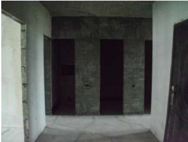
Фото 5. Оцениваемые квартиры (вид внутри)