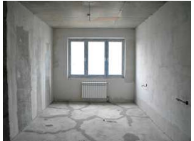
Фото 6. Оцениваемые квартиры (вид внутри)