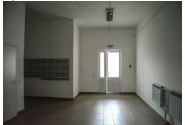
Фото 2. Места общего пользования